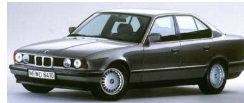
Abb. BMW 520i (E34, ab 1988 vertrieben)